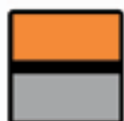
Couleur orange / platine