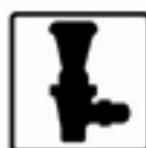
Robinet self service