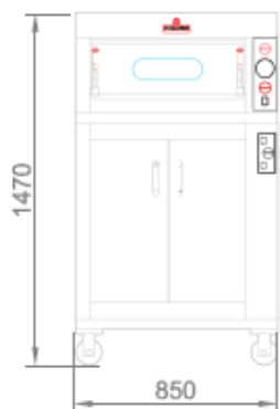
VISTA LATERALE + CELLA DI LIEVITAZIONE SIDE VIEW + PROVER