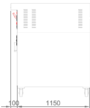
VISTA POSTERIORE + CELLA DI LIEVITAZIONE BACK VIEW + PROVER