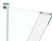
Charnières de cadre vers l'avant pour faciliter le nettoyage