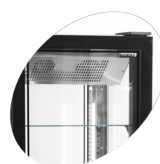
Porte sans cadre