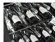
Étagères à vin en option