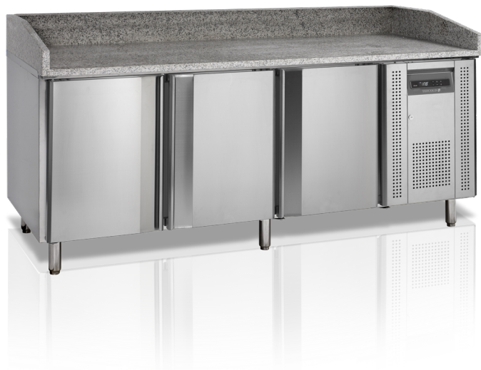
Table à pizza