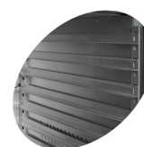
Roulettes avec et sans frein Guides pour plateaux à pâtisserie