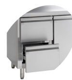
Tiroirs disponibles sous forme de kit séparé