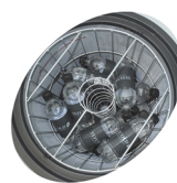
Ventilateur interne et panier