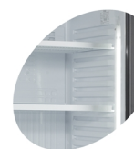
Lumière interne verticale