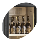
Éclairage LED dans le cadre de la porte