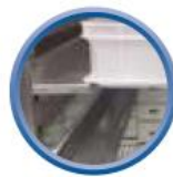
Kit 600x400 en option