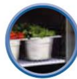
Grilles sur glissières