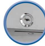
Serrure de porte