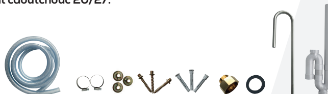
Kit complet :

Ce kit comprend 1 crosse inox, 3 m de tuyaux crystal 19/26, raccord 3/4-1/2, 1 siphon sortie verticale, collier de serrage, fixation et 1 joint caoutchouc 20/27.