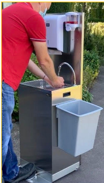
Ref. LMAH + LMASWA

Le lave-mains autonome est également disponible avec son kit d'hygiène optionnel regroupant :