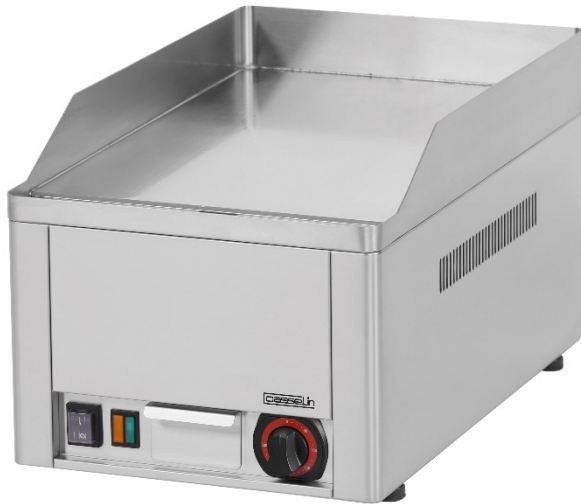
PLATE CHROME ELECTRIC GRIDDLE