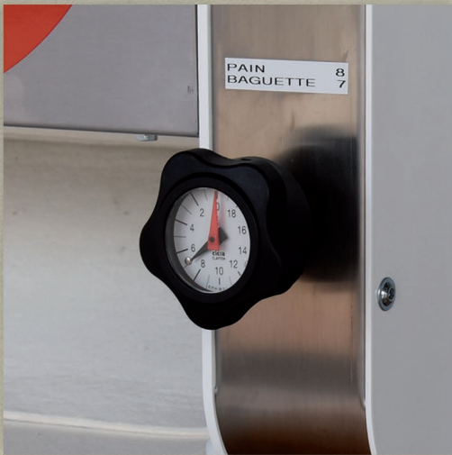
Réglage précis du laminage et de l'allongement