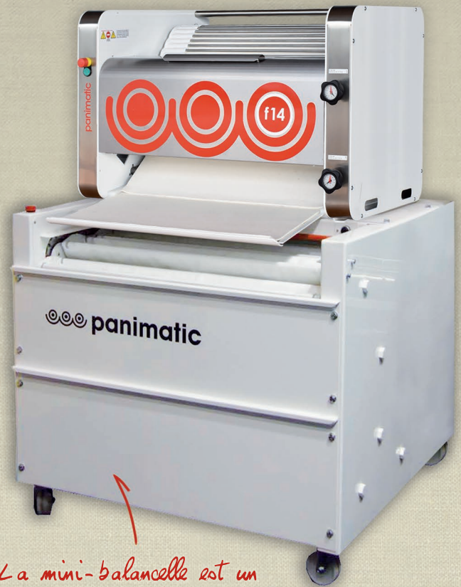
La mini-balancelle est un support compatible pour la F14 !