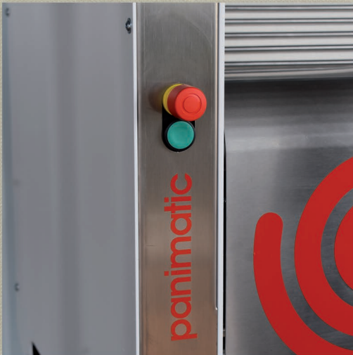
Arrêt d'urgence et bouton marche