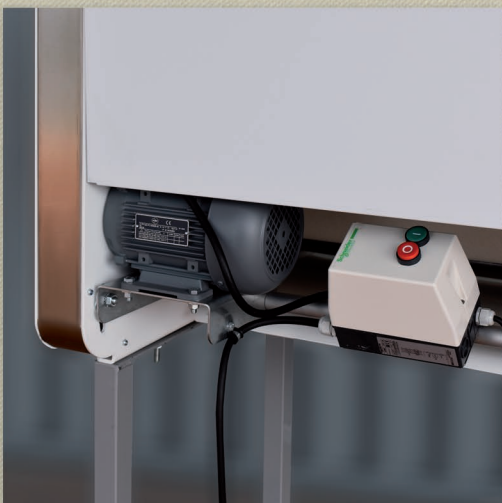
Accessibilité du moteur