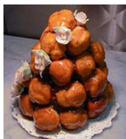
Pâte à chou