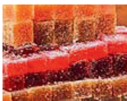
Pâte de fruits