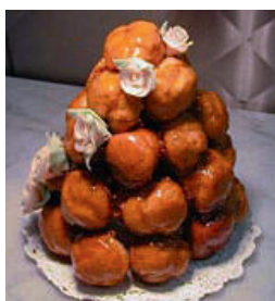
Pâte à chou