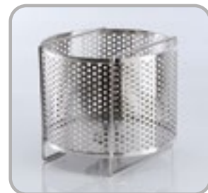
Panier de centrifugeuse en option Panier de séchage en option