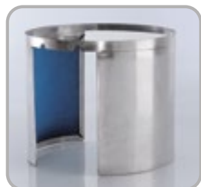
Bande abrasive amovible facultatif Bande abrasive amovible en option