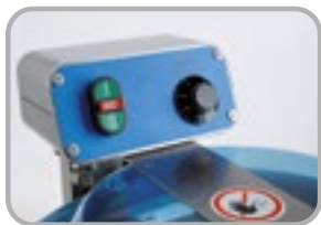
Commandes Panneau de contrôle