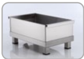
Réservoir avec filtre en acier inoxydable en option Filtre à déchets S/S en option