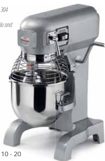
PLUTONE 10 - 20