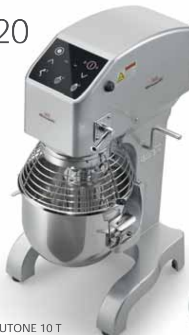
PLUTONE 10 T