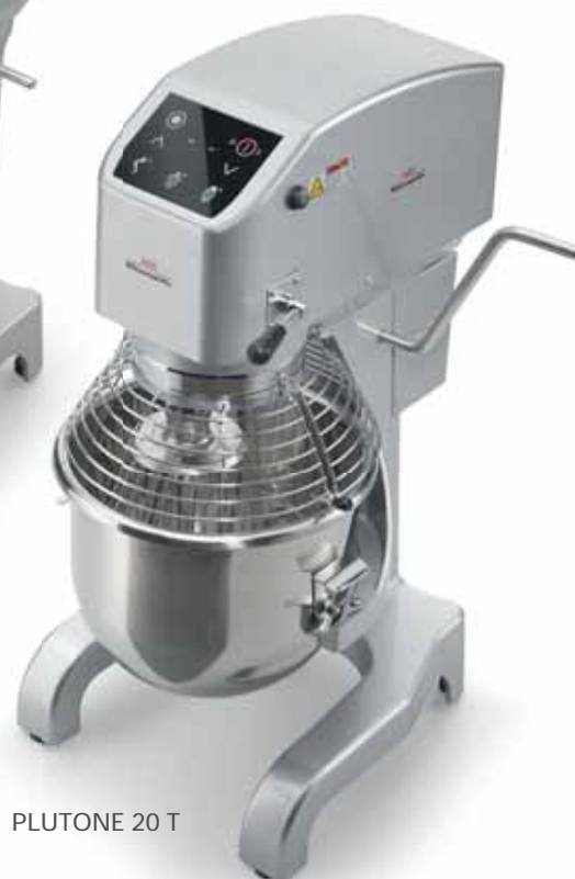
PLUTONE 20 T