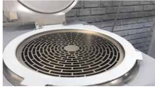
Grille de tamisage en acier inoxydable.

Système de brassage composé d'une partie fixe et d'une partie mobile qui, en travaillant en synergie, assurent une texture parfaite du produit