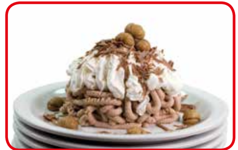
Un exemple réalisé avec le moule « Spaghetti »