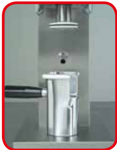
Aluminium anticorrosion moules. Moule à spaghetti compris