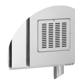
Accès facile pour nettoyer le filtre à poussière