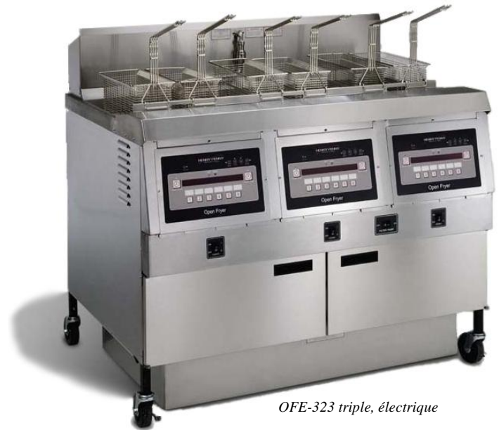
OFE-323 triple, électrique