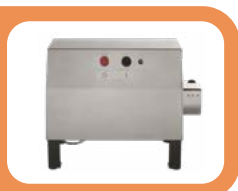
Motoréducteur à prise unique Machine universelle unique

Surtout dans les modèles à deux vitesses, chaque accessoire est capable de fonctionner dans des conditions optimales. La base pivotante -de série ou en option dans les modèles avec râpe fixe- permet de rapprocher sans effort le côté de la machine en service de l'opérateur.