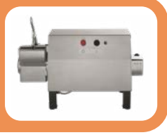
Motoréducteur monoprise avec râpe fixe Machine universelle simple avec râpe