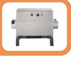
Double-réducteur à deux prises Machine universelle bidirectionnelle