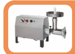
Hachoir à viande professionnel Hachoir à viande professionnel