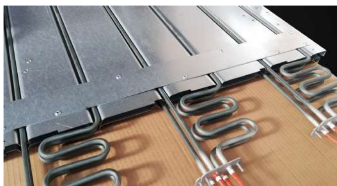
NAPPES DE RESISTANCE