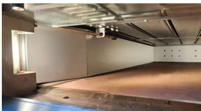
CHAMBRE DE CUISSON