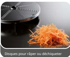
Disques pour râper ou déchiqueter

Excellent pour créer des coupes de fruits et légumes décoratives et différentes comme les agrumes, les carottes, les betteraves, les concombres, etc.