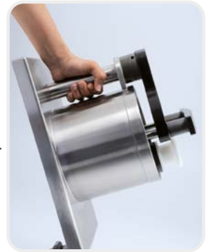
Retrait facile Facile à retirer