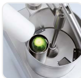
Détails de la demande pour les légumes longs

Détail de la mangeoire pour légumes longs