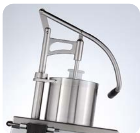
Trémie guidée - TV300TG version à levier