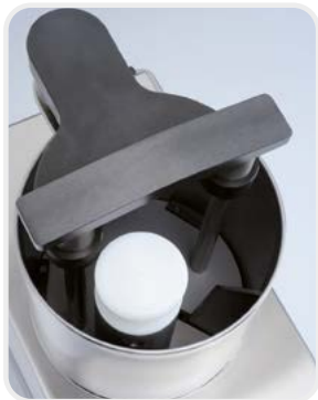
Détails de la demande pour les légumes longs

Détail de la mangeoire pour légumes longs