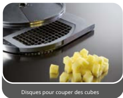
Disques pour couper des cubes