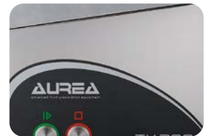
Commandes en acier inoxydable affleurantes à la machine

Détail de la mangeoire pour légumes longs