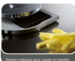
Disques spéciaux pour couper en bandes

Disque capable d'effectuer à chaque rotation des coupes horizontales ou verticales d'allumettes et de bâtonnets de légumes (Exemple : chips à frire). Les petites tailles de certaines formes sont idéales en cuisine pour présenter des accompagnements alimentaires sous des formes créatives comme couper des courgettes ou des carottes.