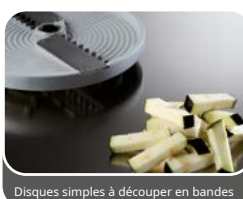
Disques simples à découper en bandes

Version spéciale avec perforation adaptée à la production de fromages à pâte dure râpés comme le parmesan, le pecorino, le pain séché et les épices comme la muscade, les racines, etc.