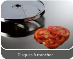
Disques à trancher

Idéal pour couper la plupart des aliments fermes comme les pommes de terre, les carottes, les navets, les courgettes, etc.