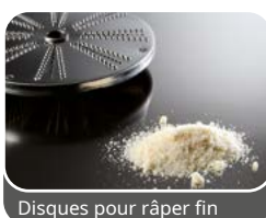
Disques pour râper fin

Râpes particulièrement adaptées au traitement des fromages à pâte molle et pâteuse, souvent indiquées pour garnir pizzas, lasagnes, tartes, etc.