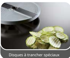
Disques à trancher spéciaux

Pour des coupes spécifiques de fruits et légumes délicats et juteux tels que tomates, poivrons, champignons, oignons, chou, pommes, agrumes, bananes, etc.