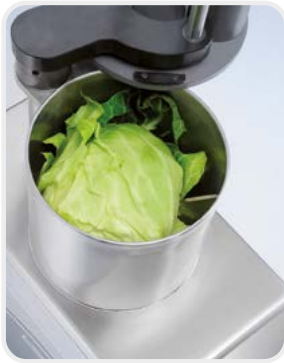
Chargement de la bouche Cavité de chargement