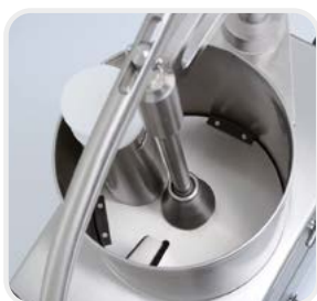
Détail de la trémie guidée

Trémie guidée - TV300TG version à levier