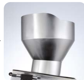
Trémie gratuite - version à chargement gratuit du TV300TL

Trémie gratuite - TV300TL version à chargement gratuit