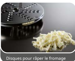
Disques pour râper le fromage

Indispensable pour réaliser des fils fins et délicats de carottes ou de chou enrichissant les salades panachées, pour râper des fruits secs comme les noix, les amandes et les noix de coco indispensables dans de nombreuses recettes de pâtisserie, pour obtenir des copeaux de fromage ou de chocolat, etc.