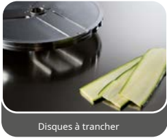
Disques à trancher

Guide pour le choix de la découpe des disques