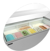
Scooping basket option