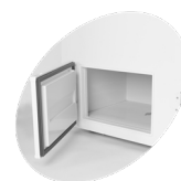
Compartiment de stockage facile d'accès