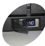
Protection de thermostat