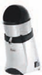
N° 52C Chromé