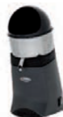
N° 52 Gris