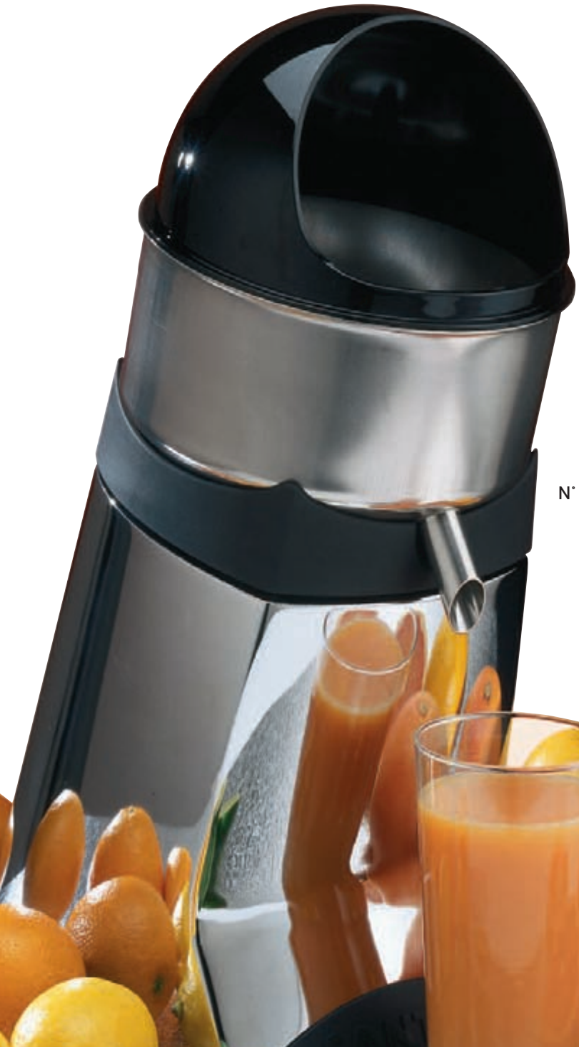
N° 52C Chromé

Pour tous agrumes : citrons verts, citrons, oranges, pamplemousses. Idéal pour les cafés, bars, hôtels, restaurants. Modèle à haut débit.