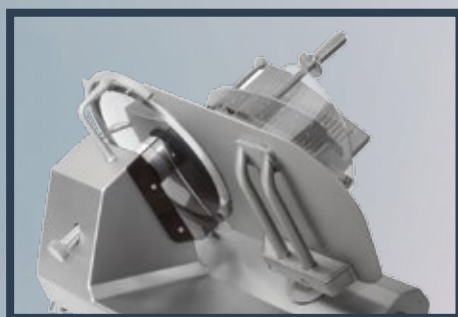
GRANDE ACCESSIBILITE POUR LE NETTOYAGE