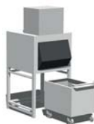
MV606+SIS700 (vendu séparément)

Cet appareil répond aux normes suivantes: