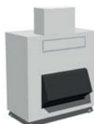
MV606+UBH1600 (vendu séparément)