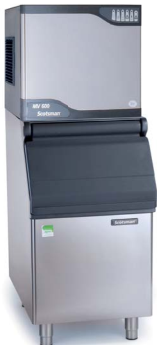
MV 606 avec SB 393 (vendu séparément)