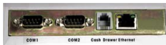
Interfaces de communication