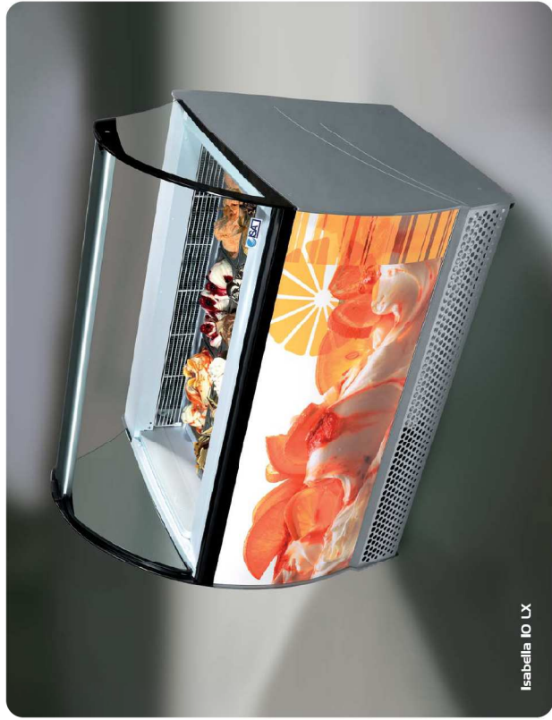
Isabella IO LX

In foreground the display capacity In Vordergrund steht die Kapazität der Anlage En premier plan la capacité expositive