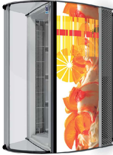
Isabella B LX

Storage space inside the display tank allowing a double row disposition Storage space inside the display tank allowing a double row disposition Storage inside the tank: • 10 on the second row + 10 on the first row + 10 on the second row + 10 on the first row • 13 on the second row + 13 on the first row