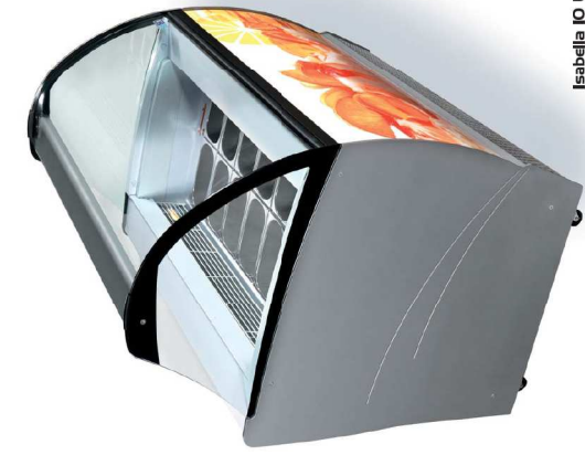
Isabella 10 LX