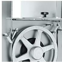
Elementary plastic blade scraper in quick to insert. Watertight black plastic flange to protect the