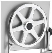
Hermetic upper pulley