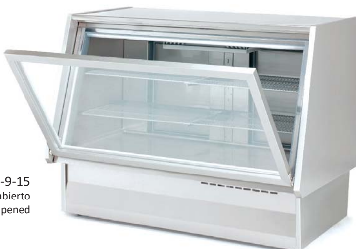
CVCC-9-15 frontal abierto front opened