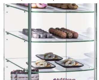
Panoramic display area and curved shelves