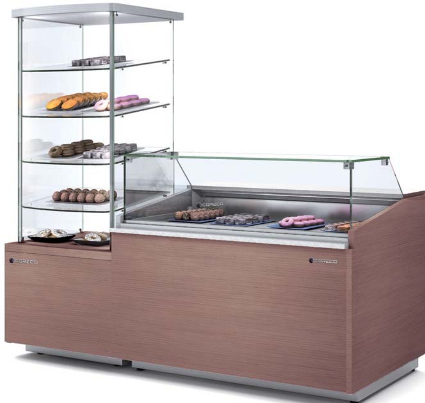
CVEG-10-15-TF + CMCT-70-VEG