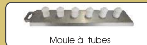
Moule à tubes