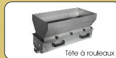
Tête à rouleaux