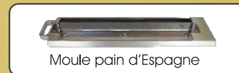
Moule pain d'Espagne