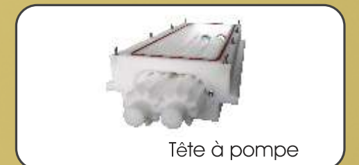
Tête à pompe