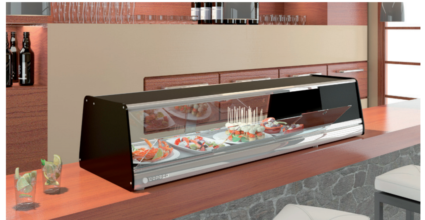
BPLA - 6