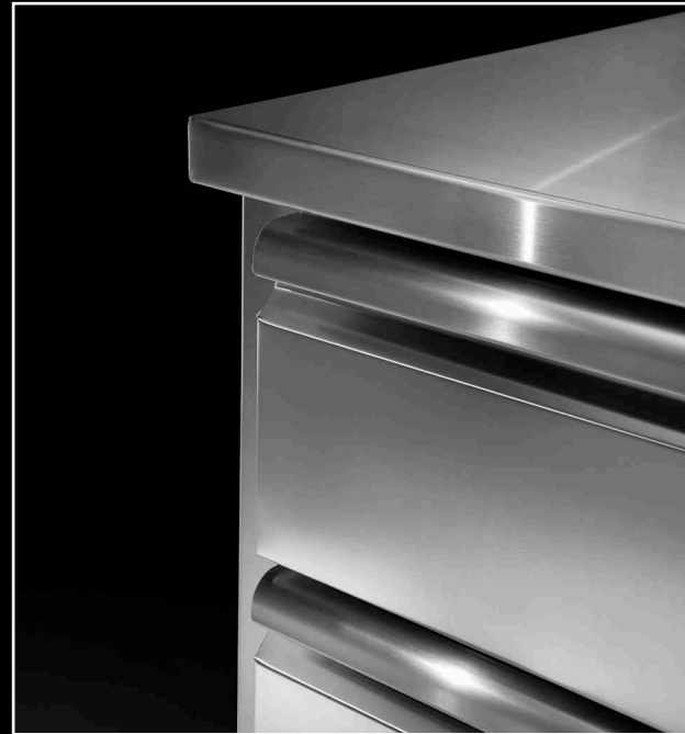
Interno ed esterno in Acciaio Inossidabile, con esclusione del fondo esterno in Acciaio Galvanizzato. Disponibile con cassetti. Inside and outside made of Stainless Steel, except for the external bottom made of Galvanized Steel. Available with drawers.