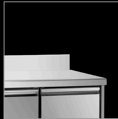
piano con alzatina

GNGRA piano in granito granite working top