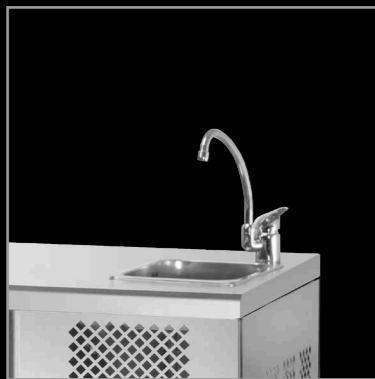
piano liscio con lavello

GNAL piano liscio con alzatina smooth surface with backsplash