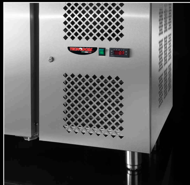
Pannello di controllo elettronico frontale con sonda NTC. Electronic front control panel with NTC probe.