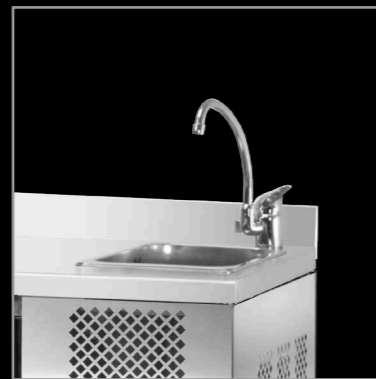
piano con alzatina e lavello

GNL piano liscio con lavello smooth surface with sink