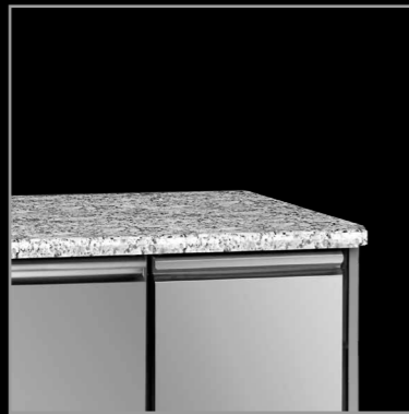
piano in granito

GNGRA piano in granito granite working top