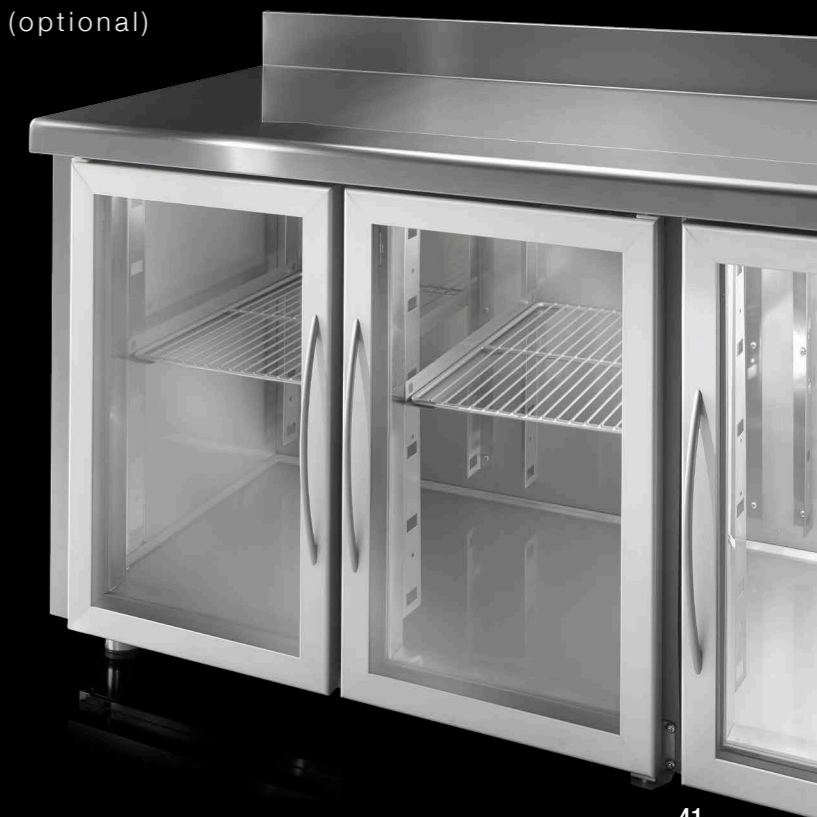
porta in vetro