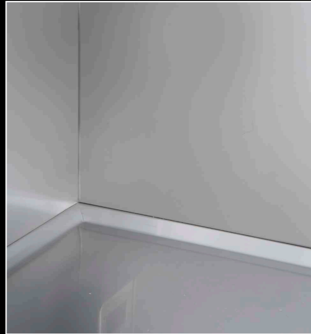
Angoli interni arrotondati. Internal rounded corners.