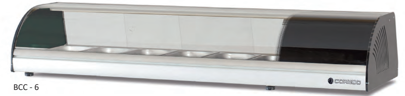
BCC - 6