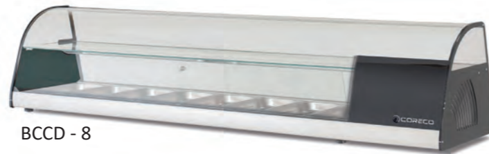
BCCD - 8