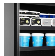
Tablettes réglables avec fonction de basculement