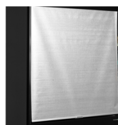
Rideau de nuit progressif