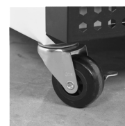
Roulettes solides en option