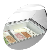
Scooping basket option