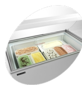
Scooping basket option