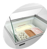
Scooping basket option