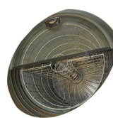
Ventilateur interne et panier