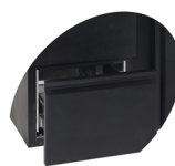
Tiroirs en option