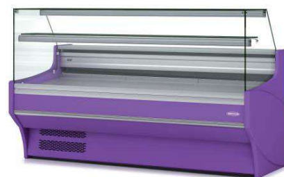
CVE-9-20-RR-TF Vitre droite double