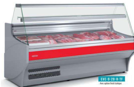
CVE-9-20-R-TF Avec option froid latéral